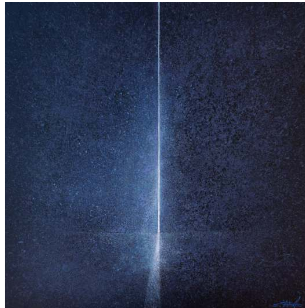
Serie ventanas de la memoria Acrílico sobre plywood 50 x 50 cm 2021