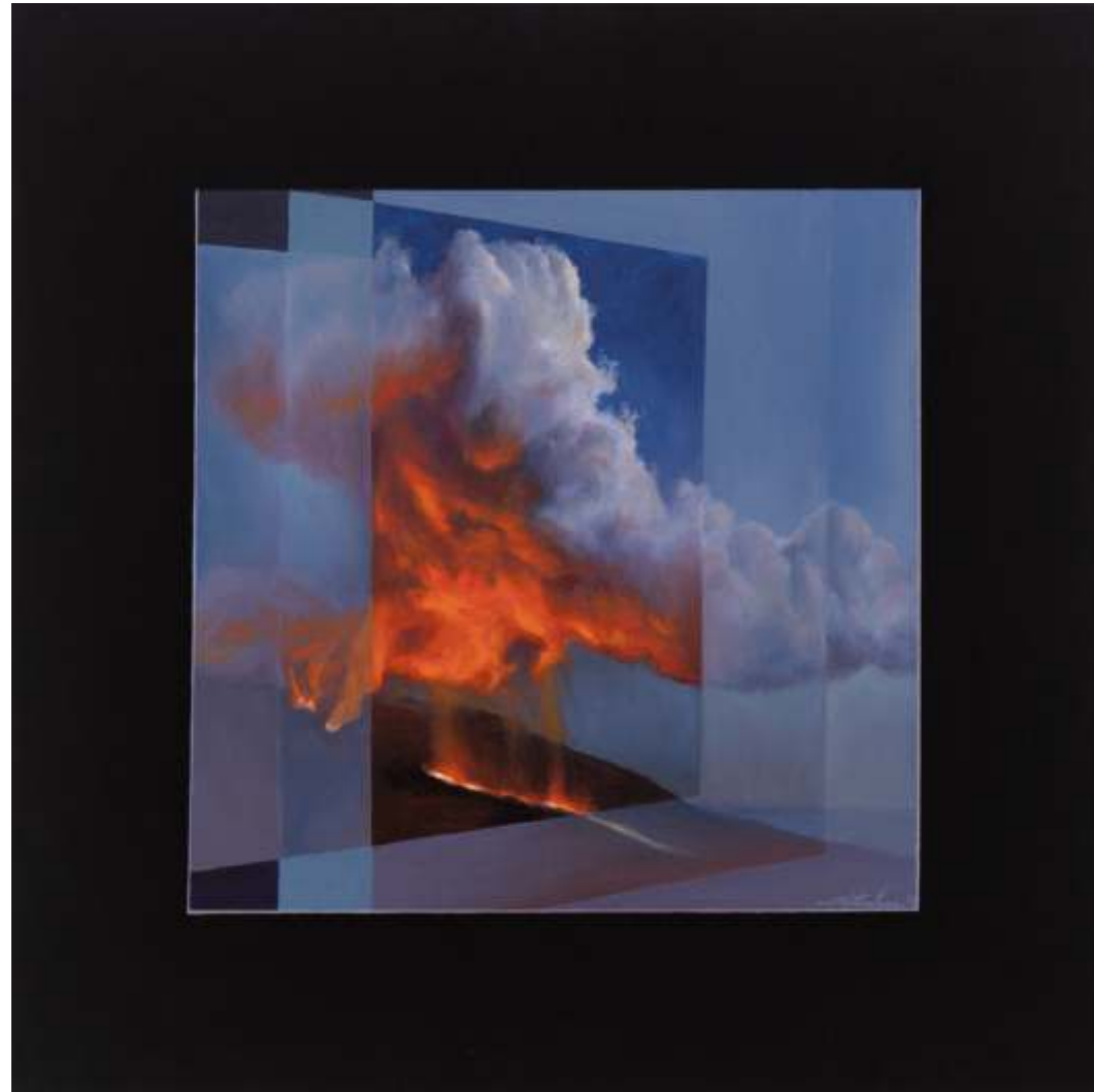
Serie ventanas de la memoria Óleo sobre lienzo tintado 70 x 70 cm 2023