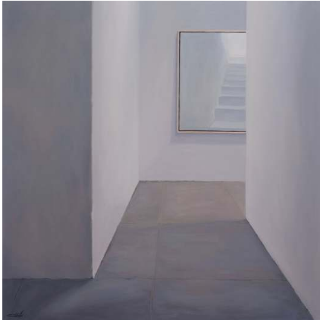
Óleo sobre lienzo. 120 x120 cm 2021