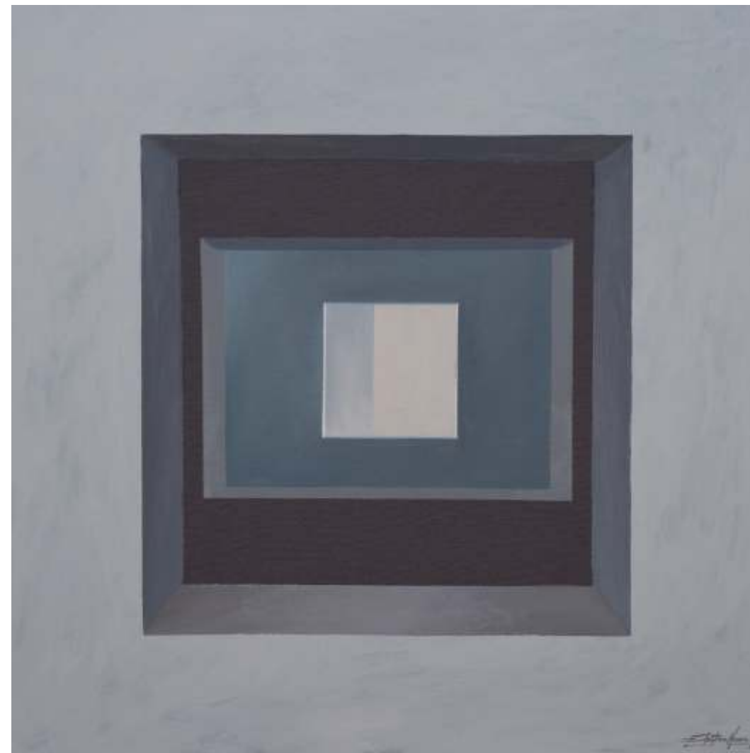
Serie ventanas de la memoria Mixta sobre lienzo tintado 70 x 70 cm 2021