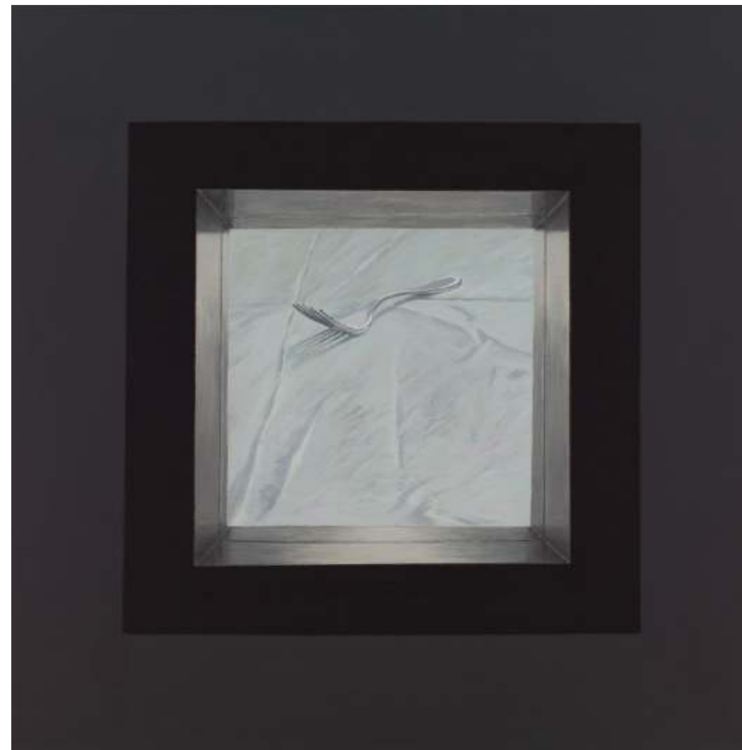
Serie ventanas de la memoria Mixta sobre lienzo tintado 70 x 70 cm 2021