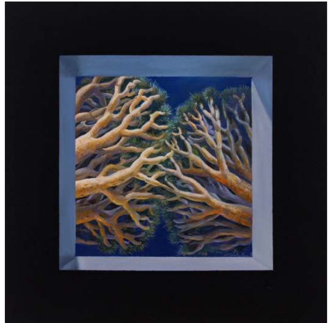
Serie ventanas de la memoria Óleo sobre lienzo tintado 70 x 70 cm 2023