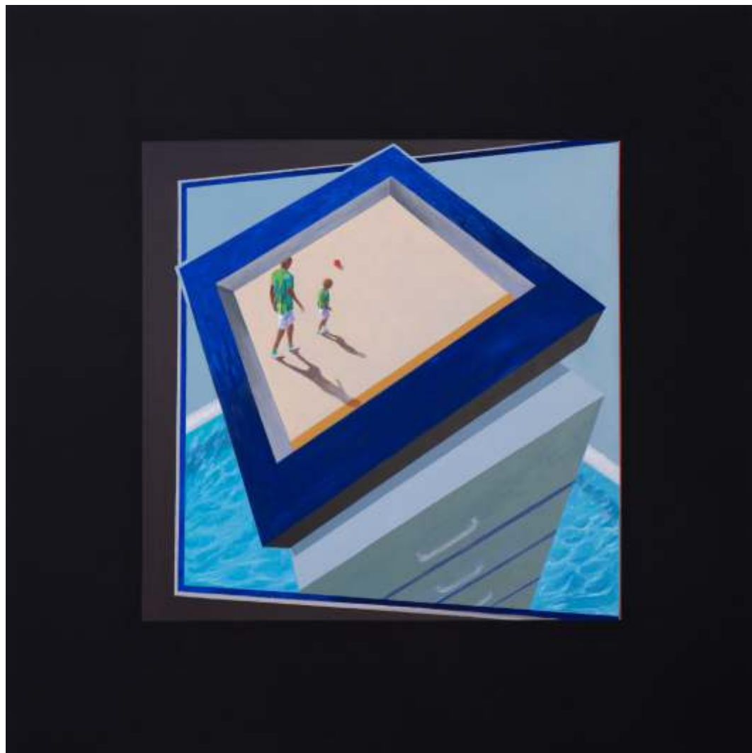
Serie ventanas de la memoria Acrílico sobre lienzo tintado 108 x 108 cm 2023