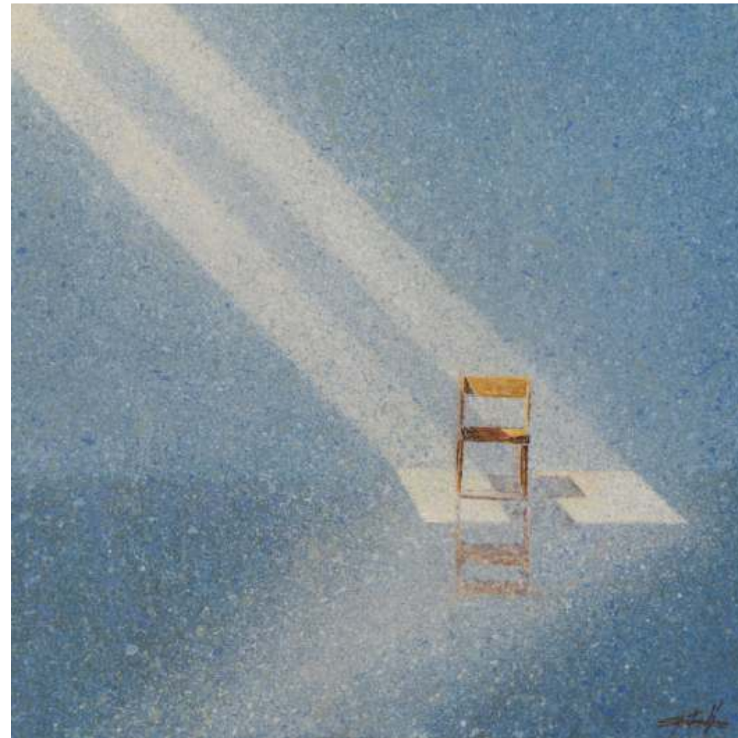
Serie ventanas de la memoria Acrílico sobre plywood 40 x 40 cm 2021