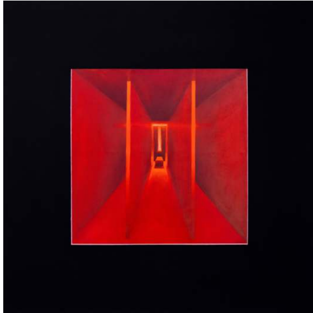
Serie ventanas de la memoria Óleo sobre lienzo tintado 108 x108 cm 2023