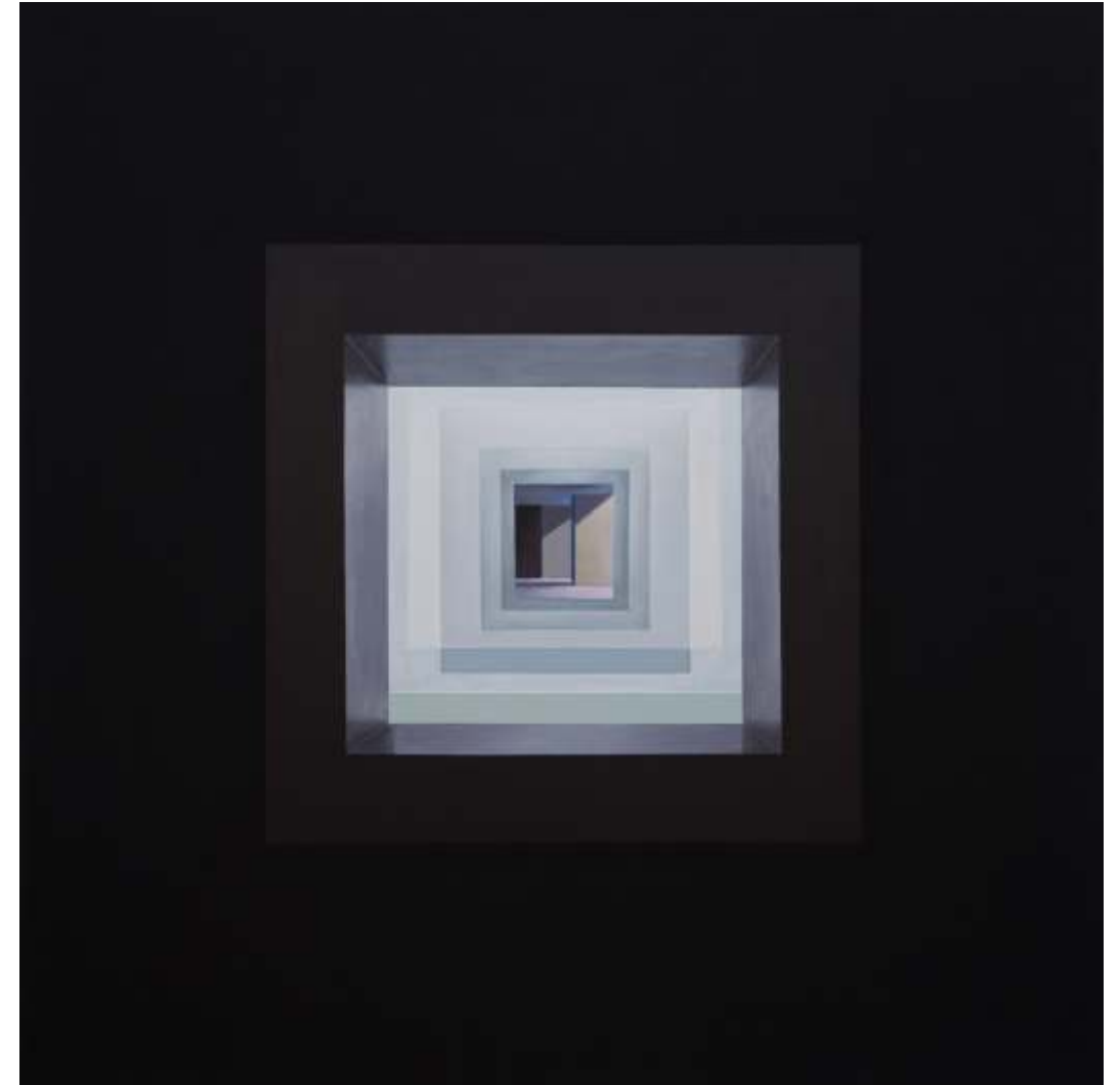
Serie ventanas de la memoria Acrílico sobre lienzo tintado 108 x108 cm 2021