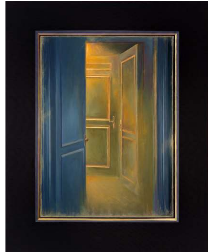
Serie ventanas de la memoria Óleo sobre lienzo tintado 81 x 100 cm 2023