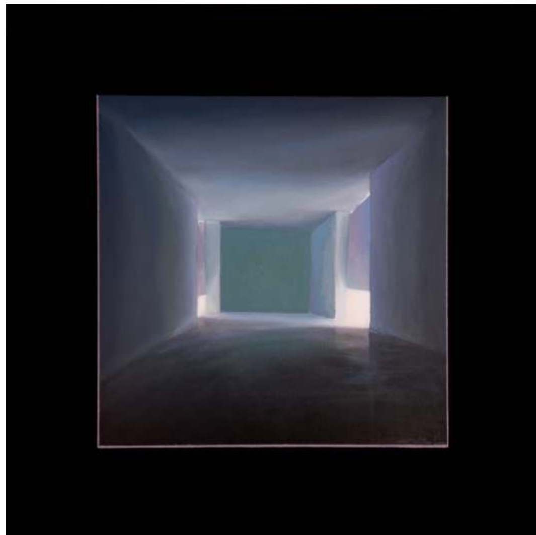
Serie ventanas de la memoria Óleo sobre lienzo tintado 70 x 70 cm 2023