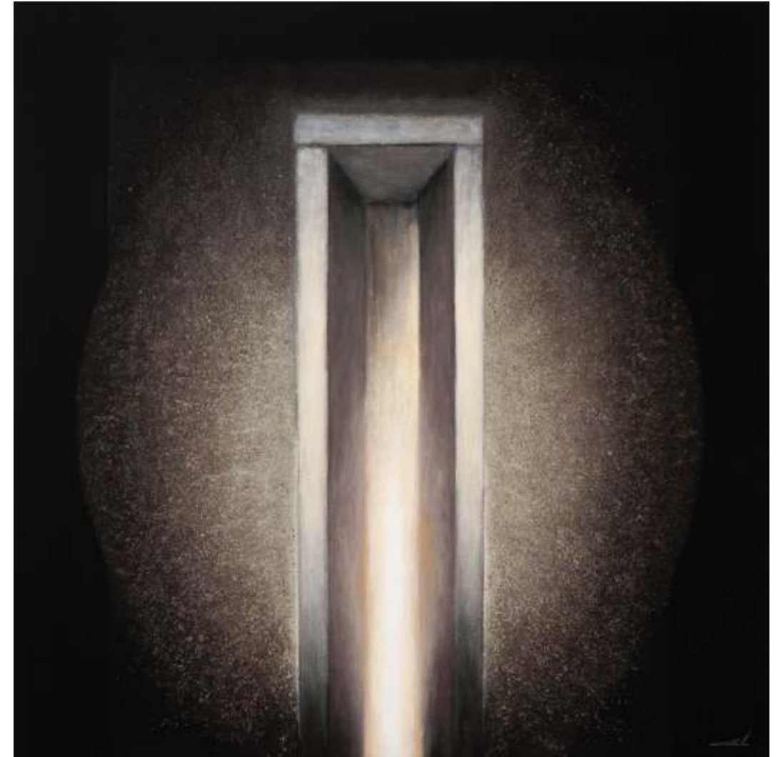
Serie ventanas de la memoria Acrílico sobre lienzo tintado 108 x108 cm 2023