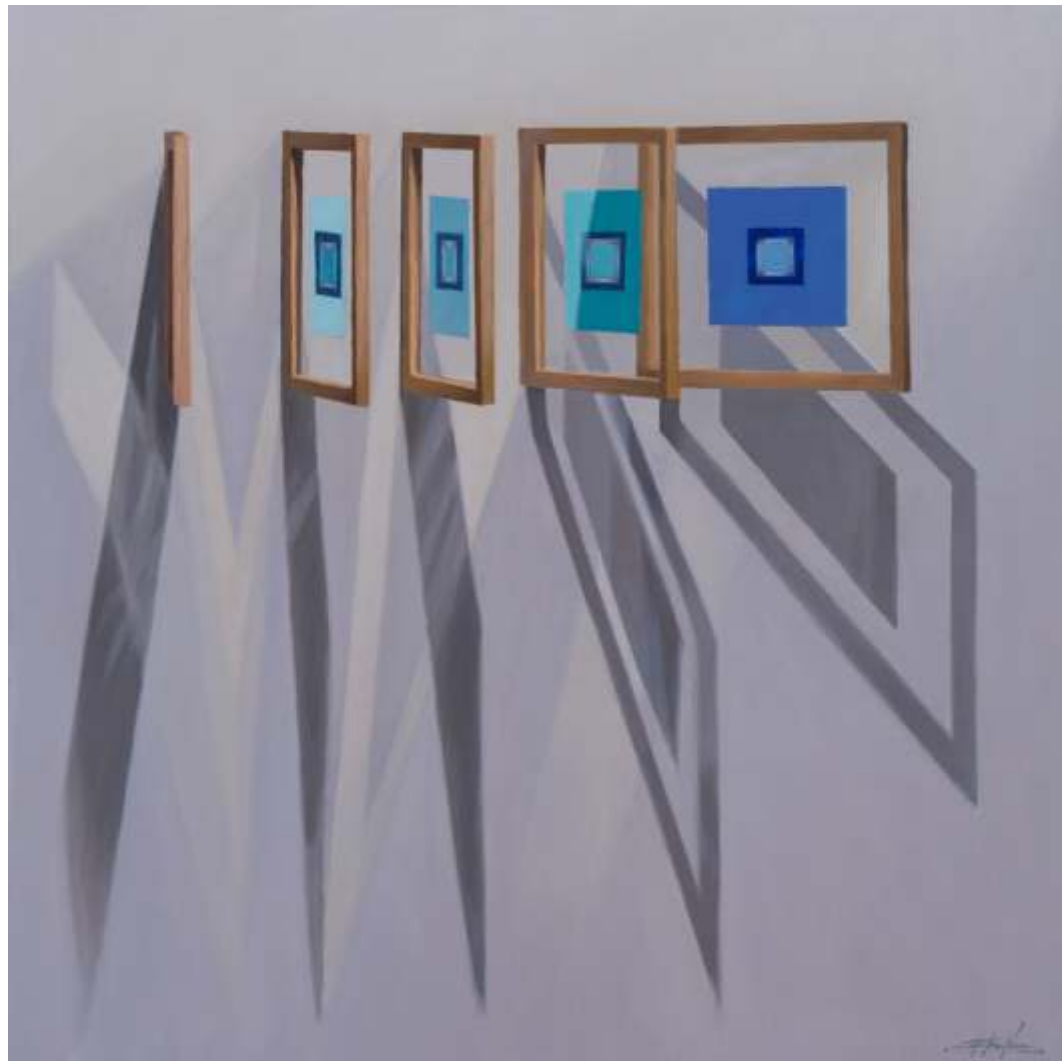
Serie ventanas de la memoria Óleo sobre lienzo 80 x 80 cm 2023