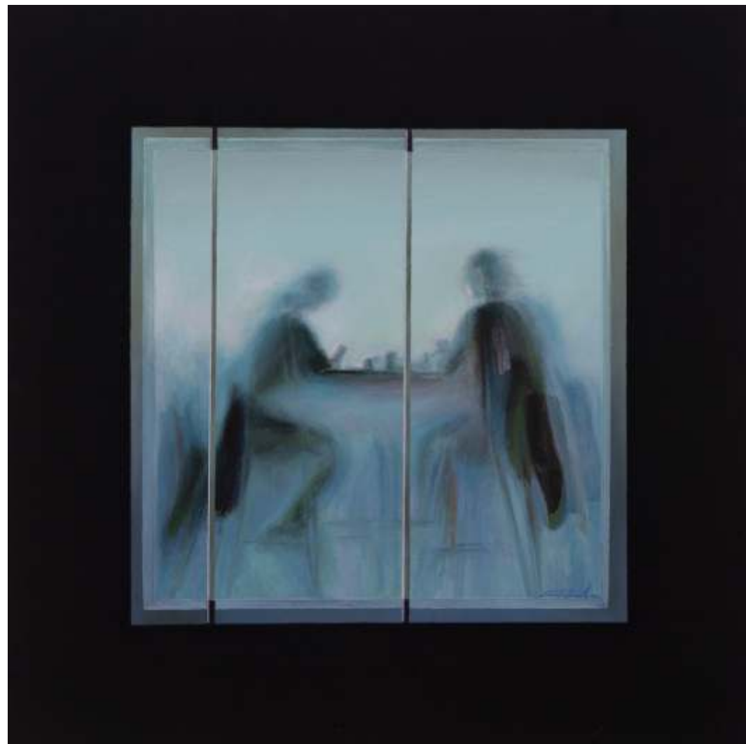
Serie ventanas de la memoria Óleo sobre lienzo tintado 70 x 70 cm 2022