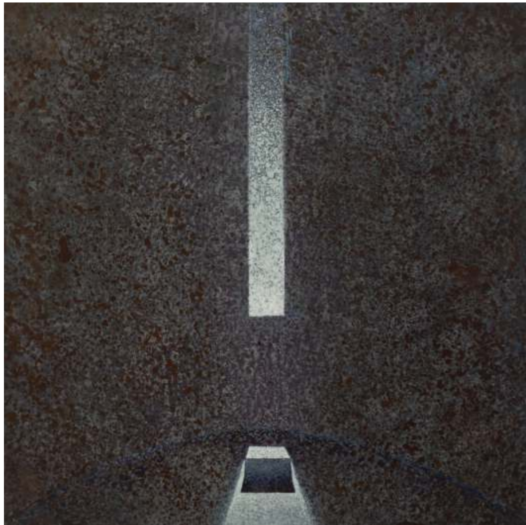
Serie ventanas de la memoria Acrílico sobre plywood 40 x 40 cm 2021