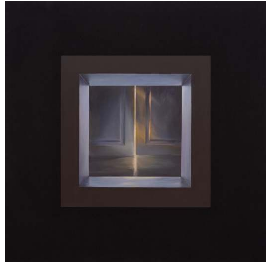
Serie ventanas de la memoria Mixta sobre lienzo tintado 108 x108 cm 2021