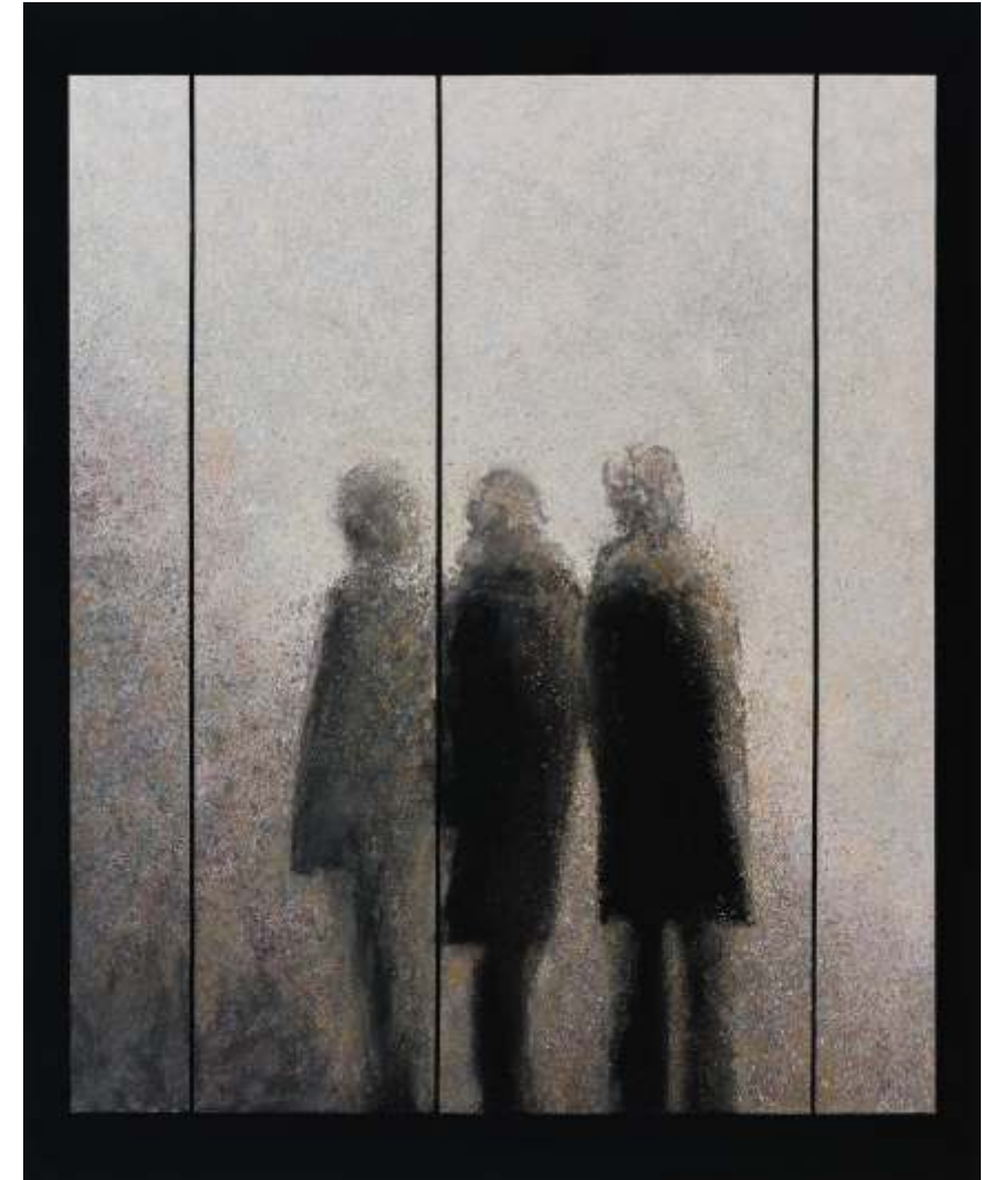
Serie ventanas de la memoria Óleo sobre lienzo tintado 114 x 146 2023