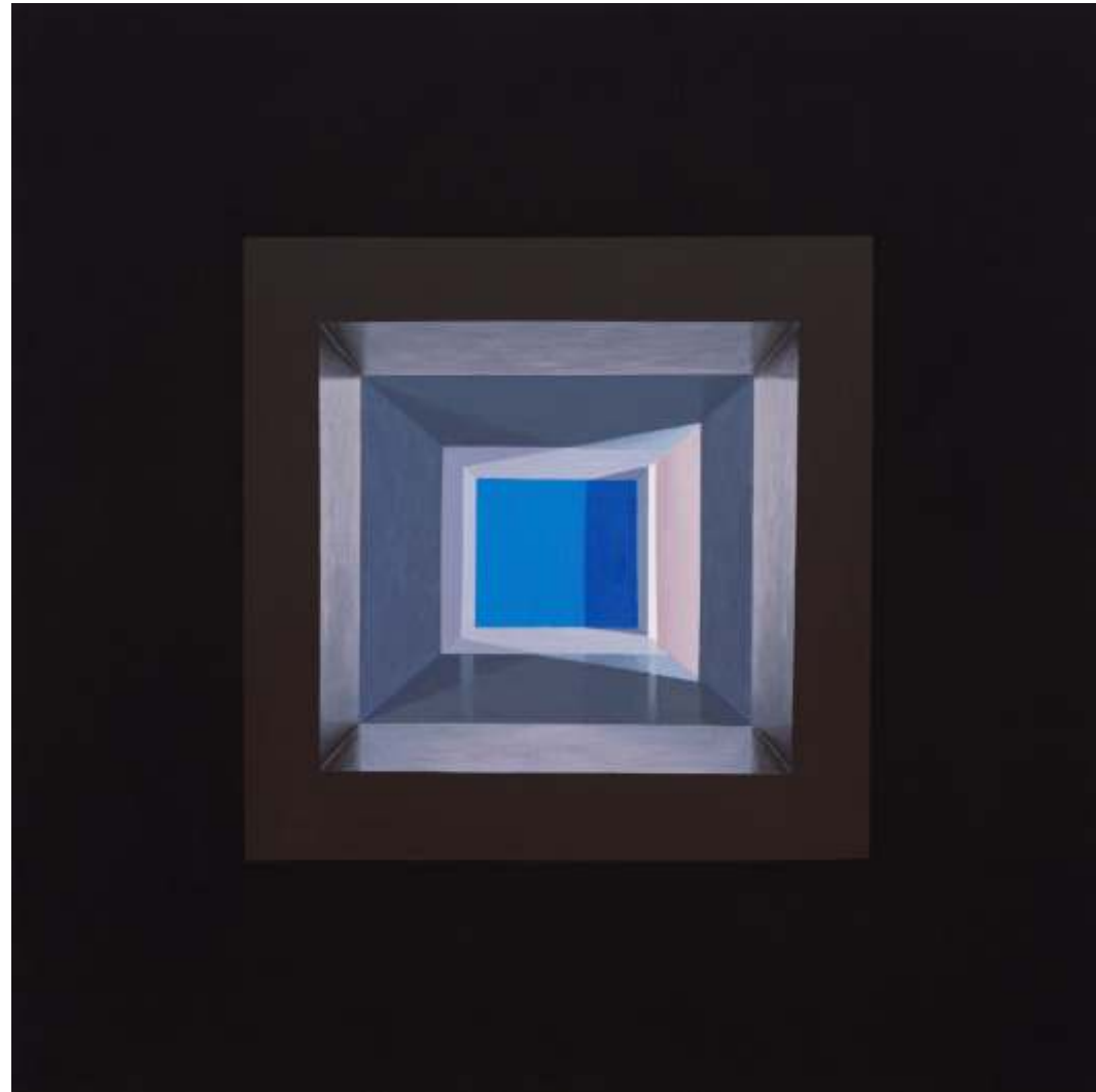
Serie ventanas de la memoria Acrílico sobre lienzo tintado 108 x108 cm 2021