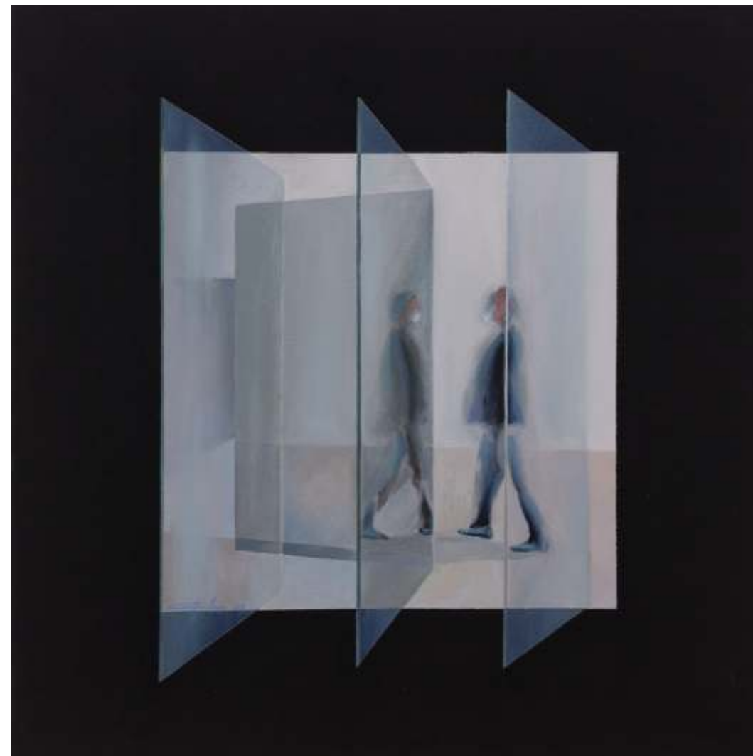
Serie ventanas de la memoria Óleo sobre lienzo tintado 70 x 70 cm 2022