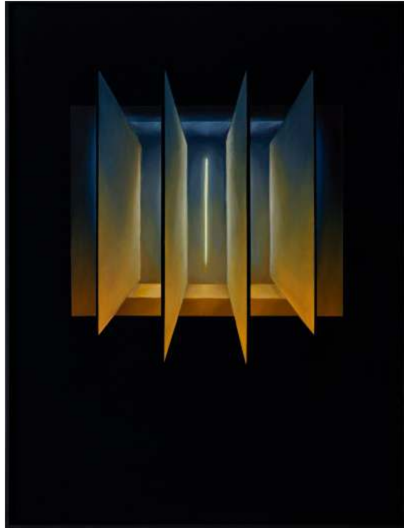
Serie ventanas de la memoria Óleo sobre lienzo tintado 120 x 90 2023